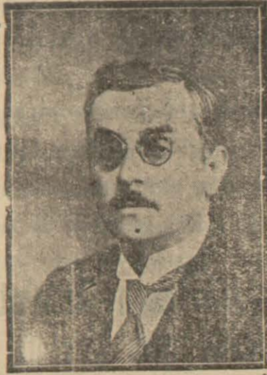
Ökonomi bakanı Celâl Bayar bilirilecektir.

Ticaret Odaları kongresi önümüzdeki Mayısta Ankarada toplanacaktır. Türk ticaretinin her yerdeki özelliklerinin bilinip öğrenilmesine ve birbiri ile alakası olan işlerin bizzat Ticaret odalarımız tarafından bir arada görüşülüp ekonomi bakanlığına teklif veya dilek halinde bildirilmesi ve bu hususta gereken kararların alınması hakkında ekonomi bakanımız Celâl Bayar çok esaslı direktifler vermişlerdir.